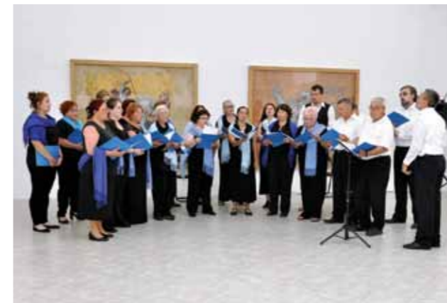
Fojtův komorní sbor, vernisáž výstavy Národ sobě , 21. 6. 2018

Galerie moderního umění sídlí v budově bývalé zámecké jízdárny, která se díky modernizaci v šedesátých letech minulého století stala jedinečným výstavním prostorem s neopakovatelnou atmosférou. Modernistický duch rekonstrukce souzní s pojetím stálé expozice. Prostředí s působivým bočním osvětlením přitahuje samo o sobě návštěvnickou veřejnost. Je zároveň lákavým a povznášejícím místem pro pořádání celého spektra kulturních aktivit z různých uměleckých oborů. Objekt galerie přes všechny své kvality vyžaduje postupné inovace. Víze radikálnějších proměn naráží na limity dané skutečností, že GMU je v budově na základě nájemní smlouvy. Tento stav je možno změnit jenom za předpokladu úspěšného jednání zřizovatele galerie s majitelem objektu. Změní-li se v budoucnu majetkoprávní vztahy a bude-li aktivita galerie podpořena mimořádnými finančními prostředky, je galerie připravena postupně realizovat potřebné změny. Pro další rozvoj objektu je možno v budoucnosti počítat s adaptací půdních prostor. Provoz galerie by po všech stránkách obohatilo přičlenění zadního křídla. Polootevřený dvůr skýtá možnost parkové úpravy. Takové řešení by umožnilo výrazně rozšířit prostory pro stálou expozici,