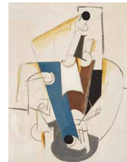
Emil Filla Láhev, sklenice, dýmka 1913 Západočeská galerie v Plzni