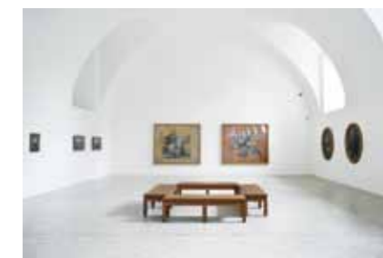
Výstava Ateliér prostor S / Experimentální architektura studentů Fakulty umění a architektury Technické univerzity v Liberci Pohled do instalace výstavy Cubr–Hrubý–Pokorný Pohled do instalace výstavy Národ sobě