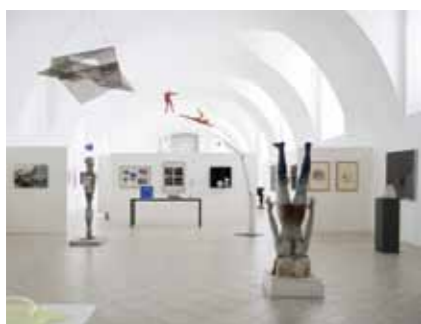
Pohled do instalace výstavy Jiří Franta, David Böhm / Sbírký jinak Pohled do instalace výstavy Jaro / Československá výtvarná scéna 1966–1968