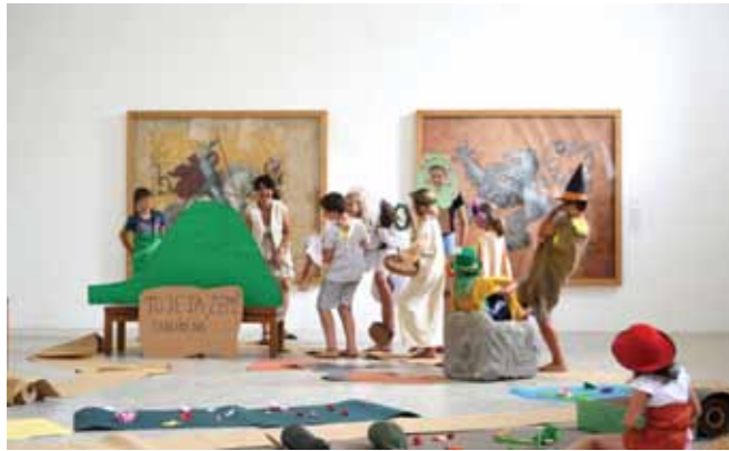
Divadelní představení k výročí založení Národního divadla v rámci Letních výtvarných dílen, 23. – 27. 7. 2018