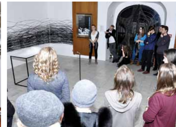
Prezentace ateliéru Prostor S Katedry environmentálního designu Fakulty umění a architektury Technické univerzity v Liberci, 1. 2. 2018