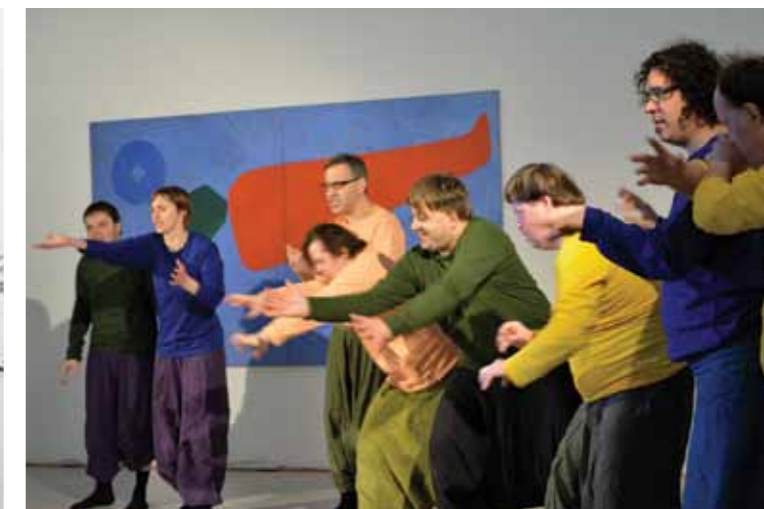
Divadelní představení O slepičí krok Studia Oáza, 24. 2. 2018