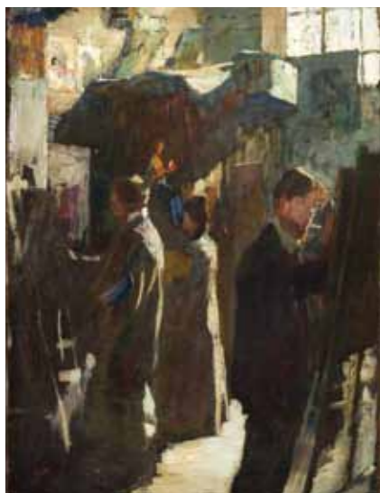
Ludvík Kuba V Ažbeho škole (1900) Jiří John Paprske 1964