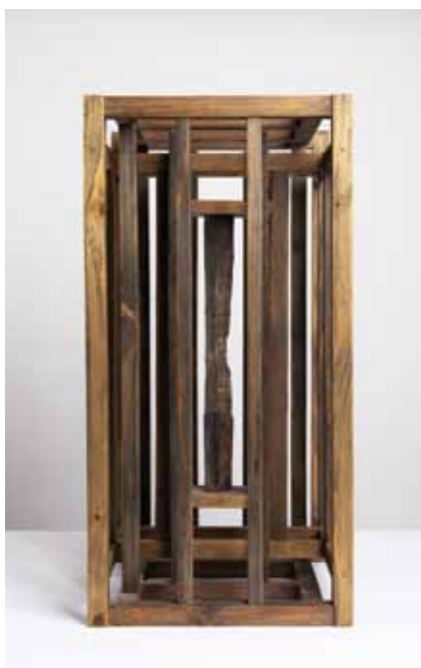
Kateřina Štenclová Malý modrý (2007) Zbyněk Sekal Schránka (1. pol. 90. let 20. století)